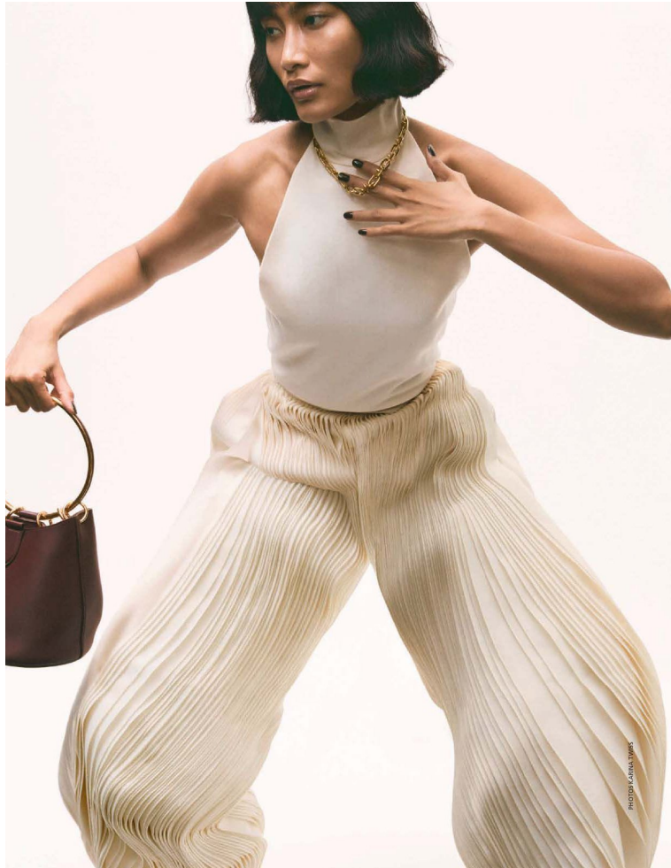
MADAME FIGARO ↘